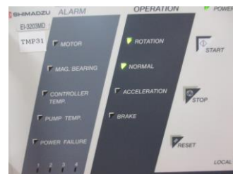
ノーマル切り替わり時操作盤