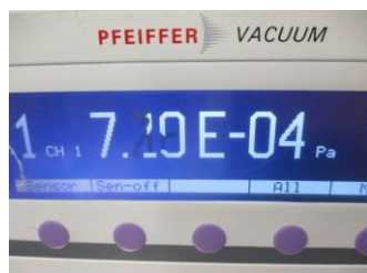
ノーマル切り替わり時圧力